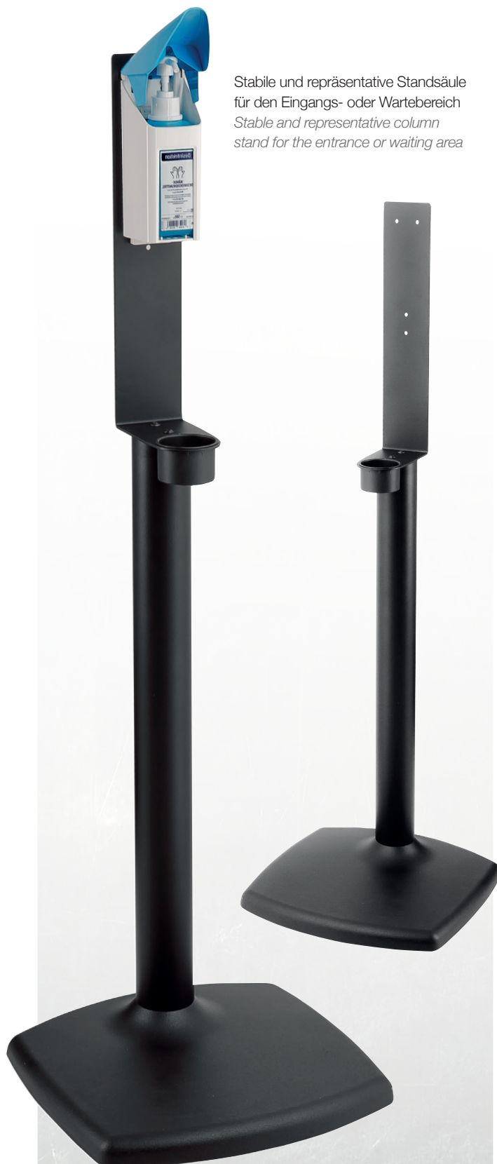
Stabile und repräsentative Standsäule für den Eingangs- oder Wartebereich Stable and representative column stand for the entrance or waiting area

Spender und Desinfektionsmittel nicht im Lieferumfang enthalten. Dispenser and disinfectant not included.