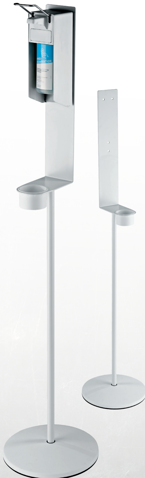
Spender und Desinfektionsmittel nicht im Lieferumfang enthalten. Dispenser and disinfectant not included.