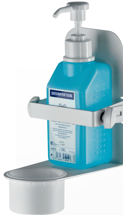
Wandhalter mit Klemmbügel zum Fixieren von Desinfektionsflaschen Wall holder with bracket to fix disinfectant bottles