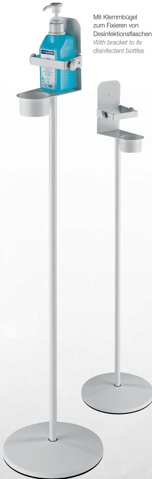
Mit Klemmbügel zum Fixieren von Desinfektionsflaschen With bracket to fix disinfectant bottles

Desinfektionsmittel nicht im Lieferumfang enthalten. Disinfectant not included.